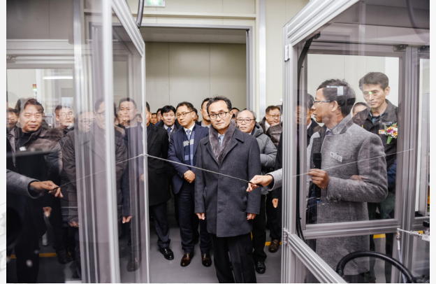
▲ 시험인증동 가스검지기 시험실에서 방위시험기에 대한 설명을 듣는 모습