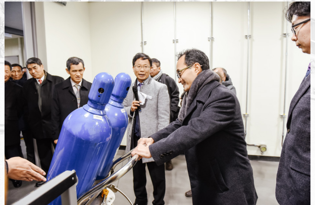
▲ 친환경연구동 실린더를 이동해보는 박원주 산업부 에너지자원실장