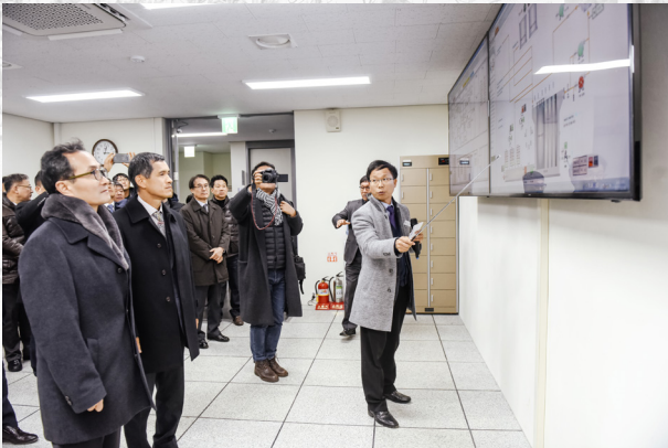
▲ 친환경연구동 중앙제어실 잔가스처리 공정 설명