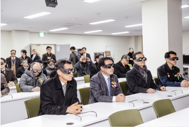
▲ 교육센터동 2층 가상현실기반 교육 훈련시스템 영상 시청 모습