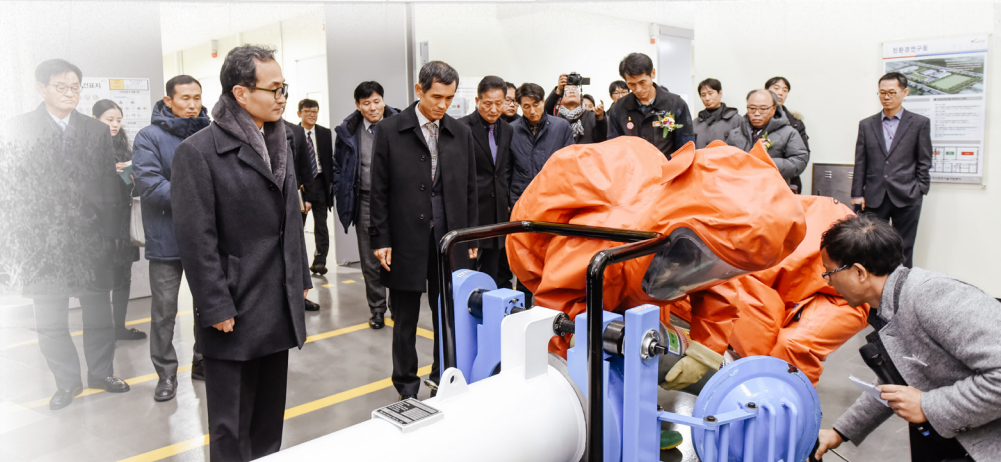
친환경연구동 ▶ 가스사고용기 밀봉 처리방법 시연